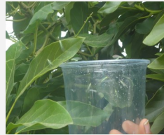
Liberación de adultos de Chrysoperla carnea en palto.