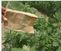
Liberación de larvas de Chrysoperla carnea en campo de quinua.

MEDIDAS Y DISPOSICION DE ENVASES VACIOS: Luego de liberar Chrysoperla sp (según fecha de liberación) y verificar que la bolsita este totalmente vacía, deposite en el lugar destinado para residuos solidos de papel y cartón.